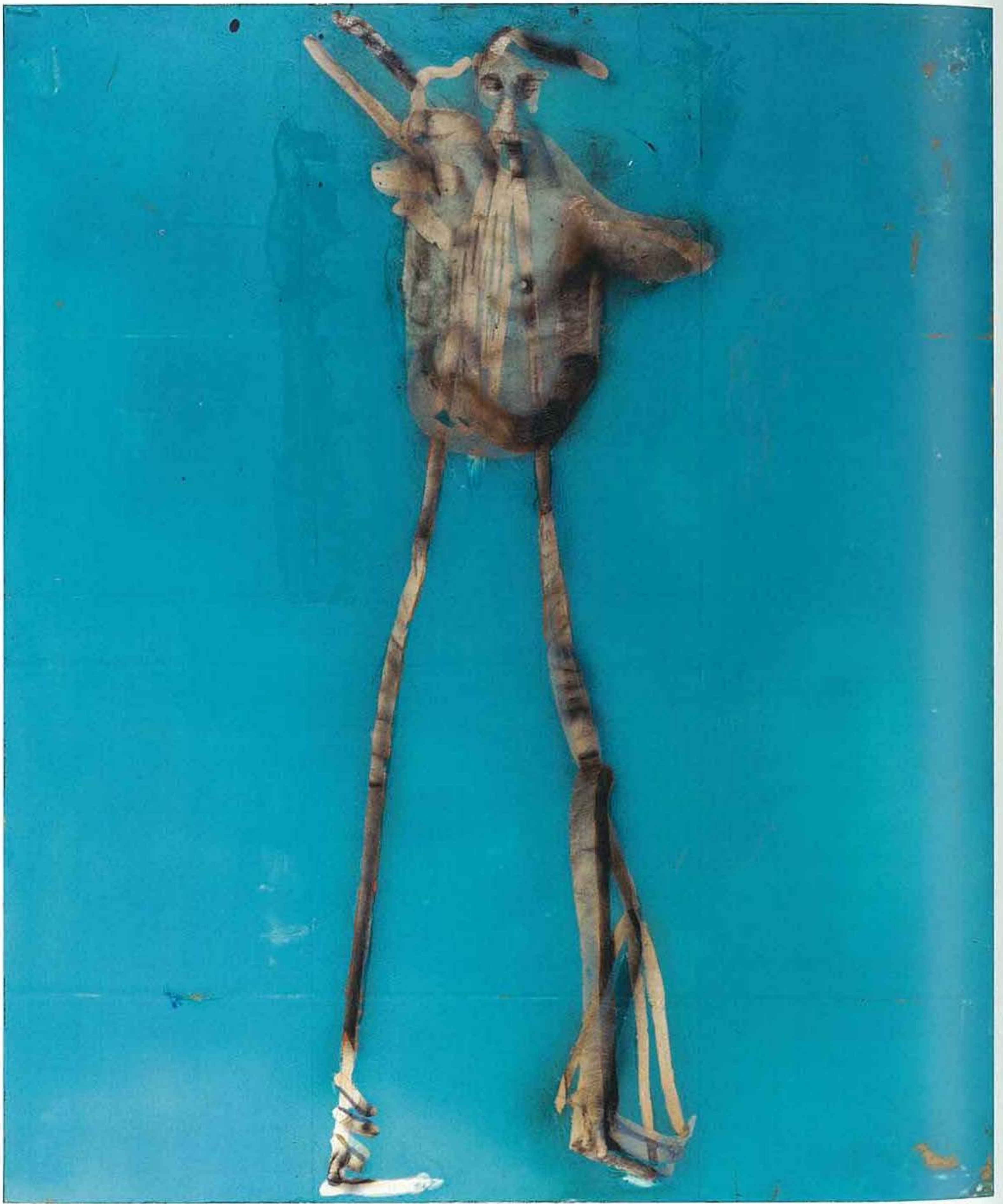
Un bañista frente al mar (Cat. 38)