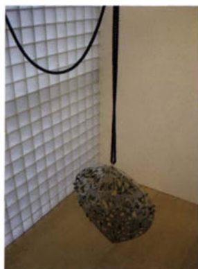
Susy Gómez: Mi madre en mí, 2009. Hierro forjado, 120 x 120 x 100 cm.

Con La lógica del lugar , Fernando Prats (Santiago de Chile, 1967) afincado en Barcelona desde 1990, tomará este singular espacio para hacerlo suyo y envolverlo de su personal lenguaje, en el que consigue, a través de acciones, resultados de gran plasticidad. En algunos casos son seres vivos como pájaros los que en su movimiento y aleteo van dejando su rastro pictórico en una superficie que sirve de soporte de una creación que se va produciendo en el tiempo y por azar. En otros son explosiones o intervenciones en variados espacios en las que los elementos conforman de nuevo, provocados por el artista, su obra. Este trabajo, en el que formas de vida o elementos inertes actúan activamente, conforma un escenario pictórico o escultórico que va consolidando un lenguaje que identifica la obra de Prats y que nos lleva a un mundo de nuevas impresiones, expresado a veces con fuerza, en otras ocasiones de manera sutil, donde el poder de su energía traspasa, como en los gestos de vida, al espectador como el aliento de un rico proceso creativo. J.C.R.